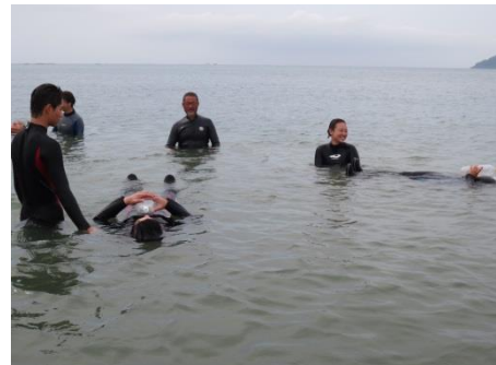
ペットボトルの浮力も体験