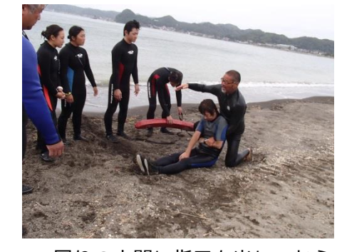
周りの人間に指示を出してから