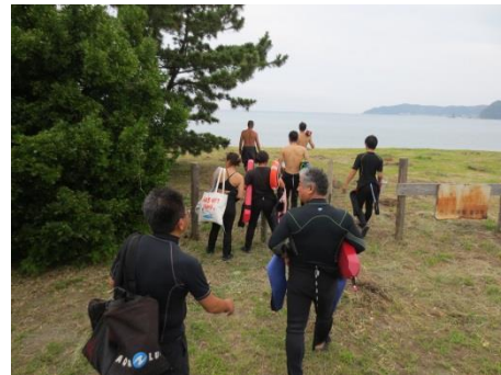
着替えて海(多田良海岸)へ