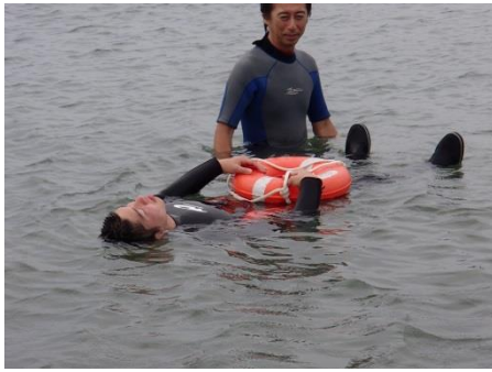
いろいろな浮き具で浮いてみる