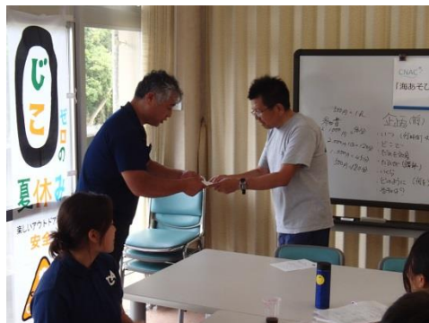
すべてのプログラムが終了し、修了証授与！

参加者の皆様の熱心なご参加により、全員無事、修了しました。 今回のセミナーの成果を是非、それぞれの団体で活用してください！