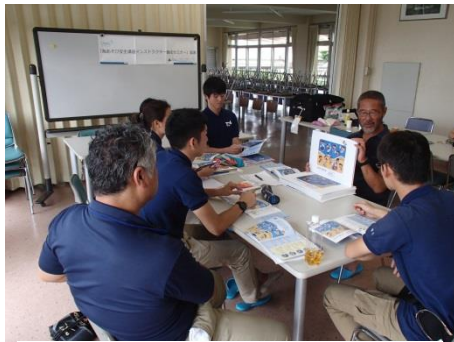
安全小冊子の紙芝居実演