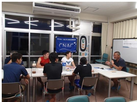
実習後のふりかえり場面