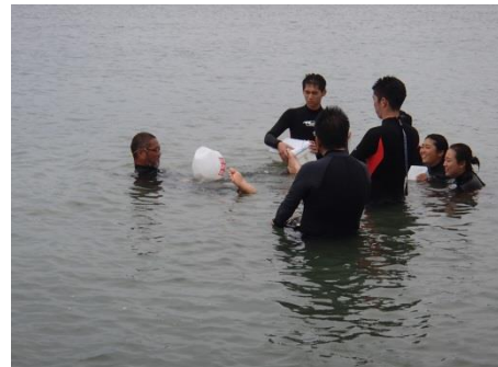
ビニール袋でも浮いてみる