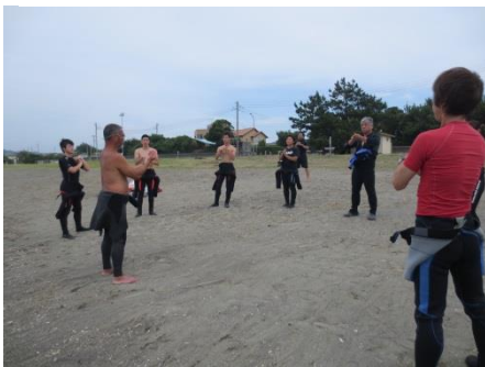
まずは準備体操をしっかりと(大事です)