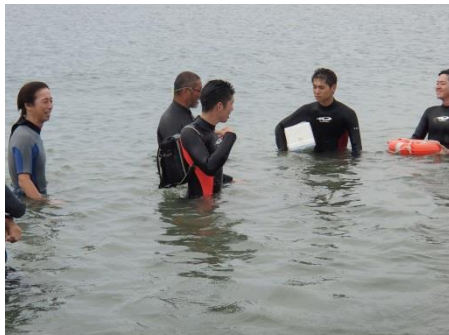
ランドセルでも浮くんです！