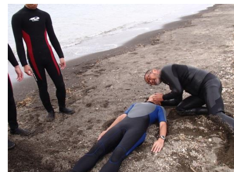
呼吸の有無を確認し