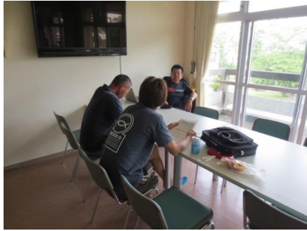
スタッフミーティング