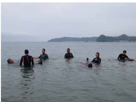
バディで交代しながらラッコ浮きの練習