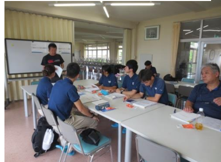
海あそび安全講座について(三好代表から説明)