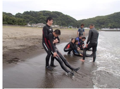
身体に覚えさせます