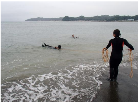
狙ったところに投げるのがこれが意外と難しい