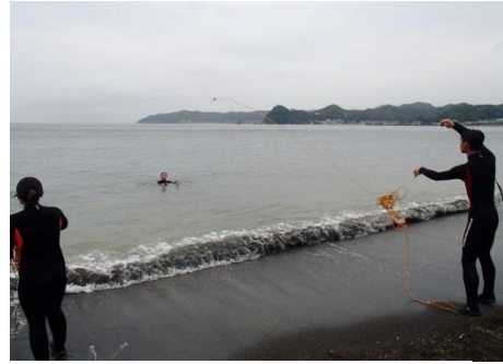
投げるのに慣れたら…今度はバディで溺れている人を助ける練習です。