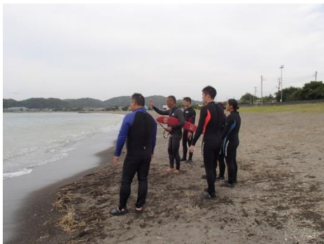
「溺れている人を発見！」