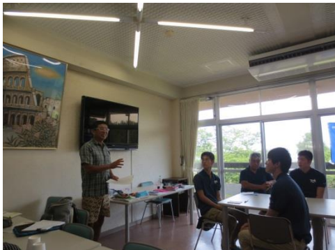
アドバイスを真剣に聞いています