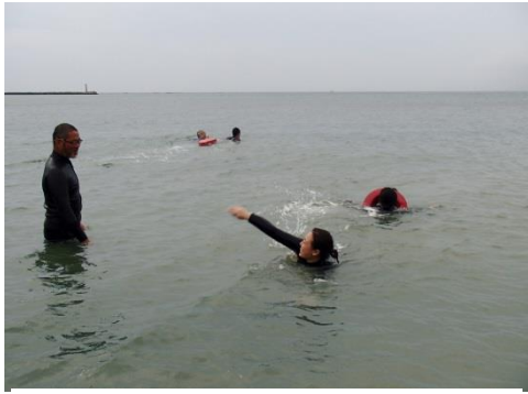
各自実習で試します