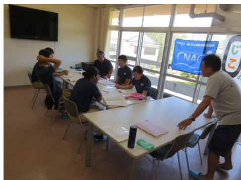
学んだことを元に、実際の安全講座の アクションプランづくりを行います