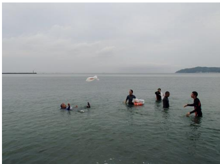
少し水を入れれば遠くの人にも投げて渡せます