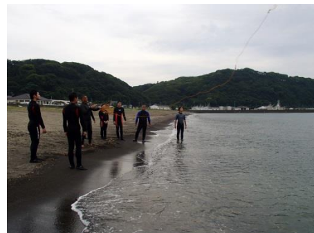
さすが遠くまで飛びますね