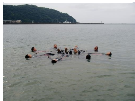
ウェットで浮く体験