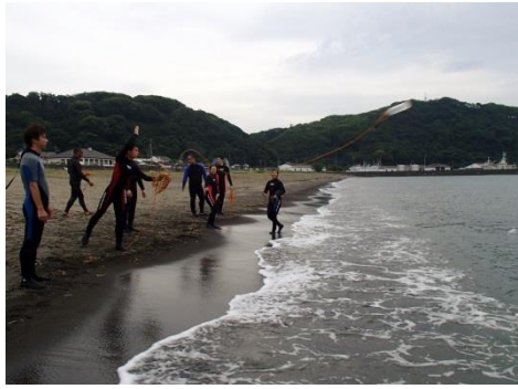
参加者の皆さんも飲み込みが早い