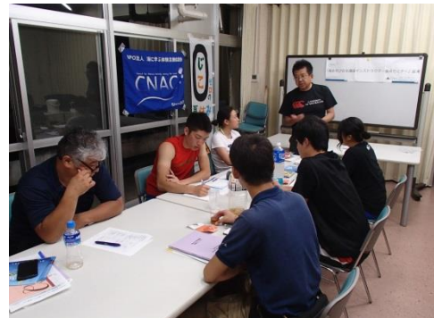
夕食後も講義が続きます