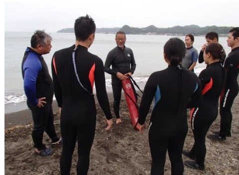
レスキューチューブも習いましょう