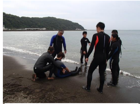
一人で人間を起こす方法も学びます