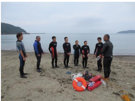
次はペットボトルレスキューを習います